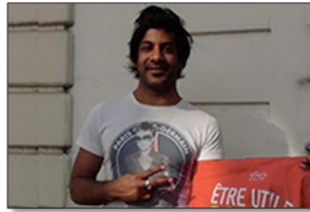
Vikash Dhorasoo, ancien footballeur et fondateur du collectif tatane, soutient l'Afev ! Découvrez son témoignage en cliquant ici