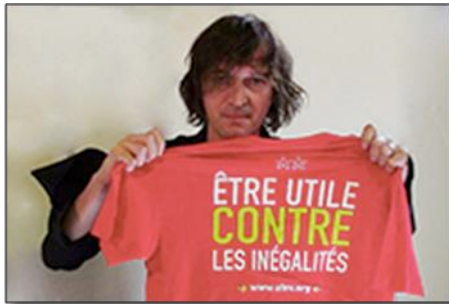
Cali, chanteur, soutient l'Afev ! Découvrez son témoignage en cliquant ici

Chanteur, rappeur, sportif, professeur... Ils ont tous un point commun : ils partagent les mêmes valeurs que l'Afev et encouragent tous les étudiants à s'engager aux côtés de l'association !