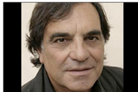
Marcel Rufo, pédopsychiatre, soutient l'Afev ! Découvrez son témoignage en cliquant ici