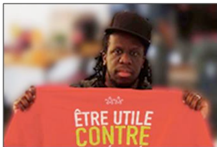
Youssoupha, rappeur engagé, soutient l'Afev ! Découvrez son témoignage en cliquant ici