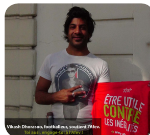
Vikash Dhorasoo, footballeur, soutient l'Afev.

Vikash Dhorasoo, ancien footballeur international français devient parrain de l'Afev. Vous le connaissiez peut-être pour ses exploits sportifs, et bien sachez que cet ancien joueur s'associe à l'Afev pour défendre les valeurs de partage, d'entraide et de solidarité. Découvrez sans plus tarder son message vidéo sur notre chaîne Dailymotion Afev TV, dans lequel il souligne les forces de l'accompagnement individuel.