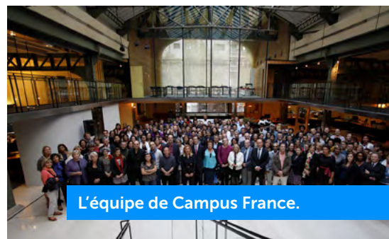
L'équipe de Campus France.