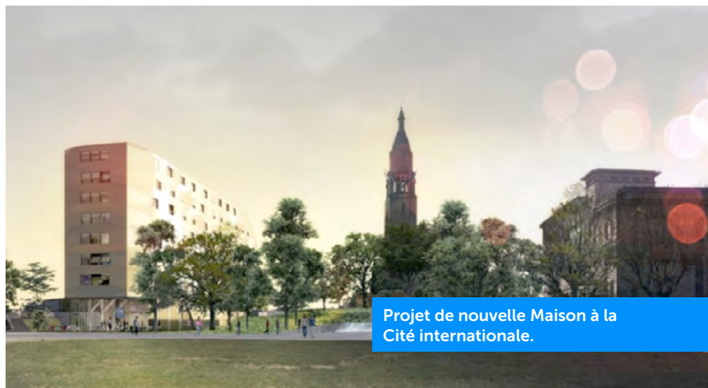
Projet de nouvelle Maison à la Cité internationale.

Les façades sur le parc, en panneaux isolants très performants, sont composées à partir des grandes fenêtres de chacune des chambres étudiantes. C'est un effet de mosaïques en facette, changeantes sous la lumière qui est recherché. Les faces ciselées jouent avec le feuillage des arbres et la douceur du relief. La façade donnant sur le périphérique est très différente. Composée essentiellement de capteurs photovoltaïques et de tubes solaires thermiques, elle laisse entrevoir en son centre une structure en étoile (maintien de ces tubes) et, à l'arrière, le réservoir de stockage de l'énergie. Cette mise en scène insolite marque de manière particulière la Maison sur le périphérique, tout en laissant deviner son dispositif énergétique.» ■