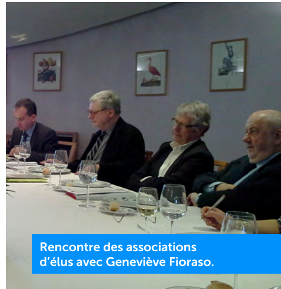
Rencontre des associations d'élus avec Geneviève Fioraso.