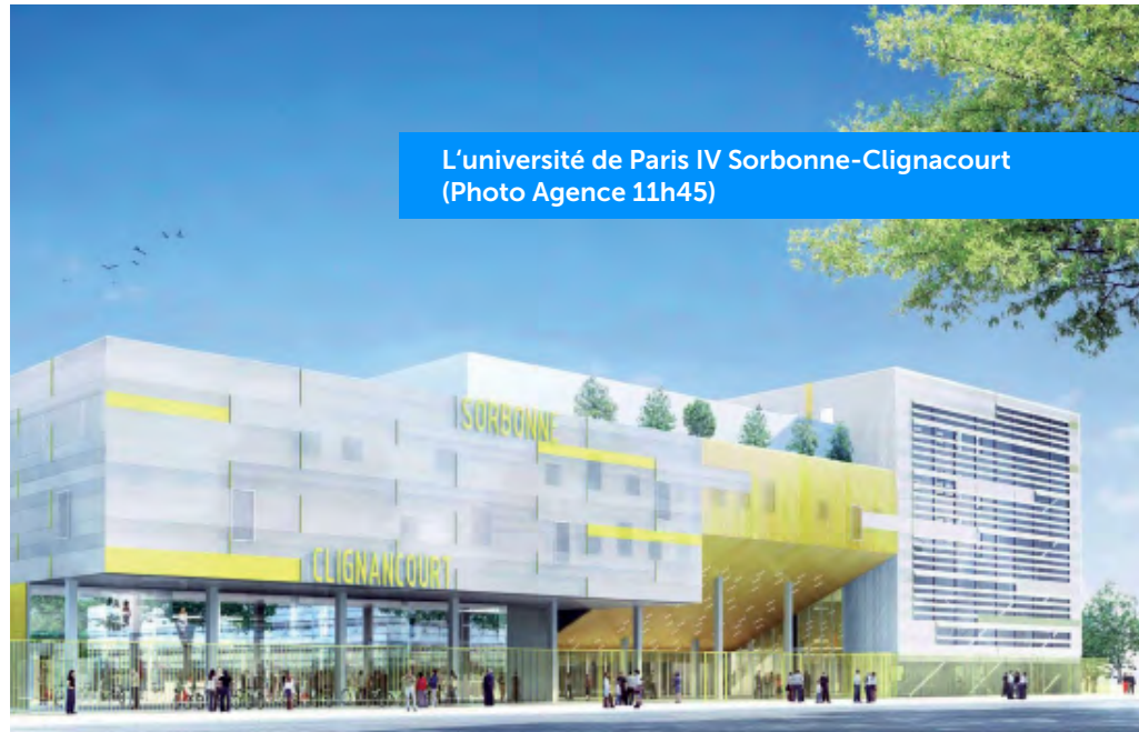
L'université de Paris IV Sorbonne-Clignancourt

« L'université française doit se moderniser pour figurer parmi les pôles d'excellence internationaux. Notre mission est de lui délivrer plus de services pour des bâtiments adaptés, connectés, flexibles et évolutifs et offrir ainsi un environnement dédié au travail et à la connaissance ». Pour cela Bouygues Énergies & Services intègre de nouveaux outils de partage (téléprésence, audio, web conférence...) et permet l'accès simplifié et en temps réel à l'information (e-administration, relais d'informations numériques...). En effet, sans jamais oublier d'assurer la flexibilité de ces bâtiments, la destination des salles dans le temps pouvant en être modifiée, une université se rénove pour 20 à 30 ans.