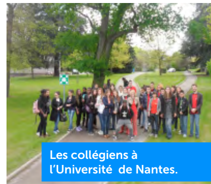
Les collégiens à l'Université de Nantes.

Afin de mieux faire comprendre la vie étudiante, le dispositif propose aux collégiens et lycéens participant aux ateliers des visites des établissements d'enseignement supérieurs.