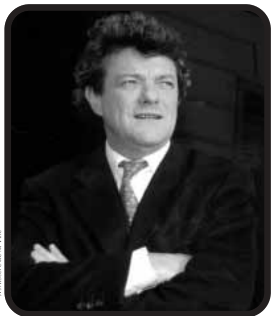
Ministère de la Ville

« Nos quartiers sont de véritables cités internationales : nous devons utiliser cette forme de richesse pour en faire un outil de l'apprentissage et du savoir. »